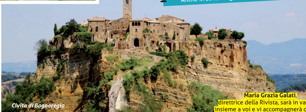
Civita di Bagnoregio