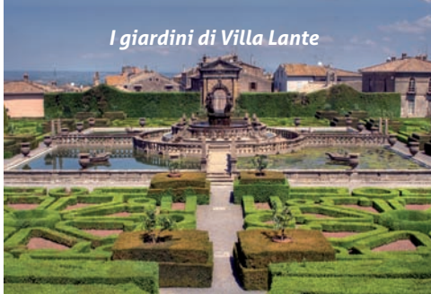
I giardini di Villa Lante